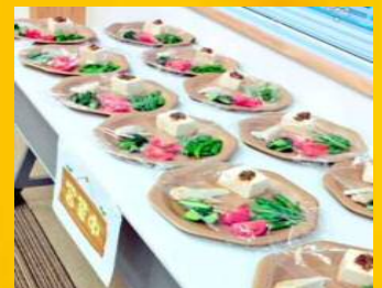
150kcal の おつまみセット