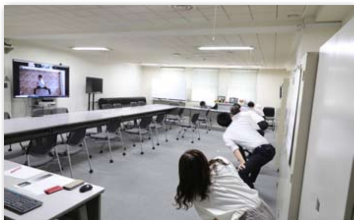
週1回のオンライントレーニングの様子

この他にも週1回のオンライントレーニングや月2回の健康や栄養情報の配信、報奨制度、みんなで歩活への参加などを行った結果、高かった肥満率や健診有所見者割合に減少傾向が見られるようになり、特に40代～50代の健康意識が高まっているように感じます。