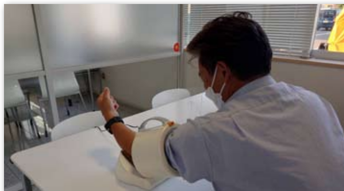
血圧測定器の設置