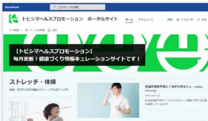
健康づくり情報キュレーションサイト「トビシマヘルスプロモーション」