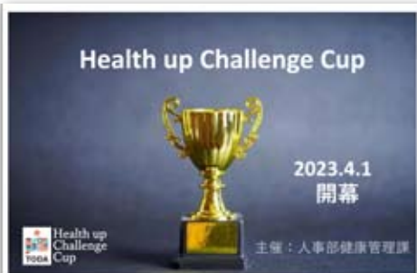
「ヘルスアップ チャレンジカップ」 ポスター

また以前から実施している健康診断後の有所見者に対する社内保健師・看護師による保健指導・保健相談についても精力的に進めており、職員にとって身近な相談先となっています。