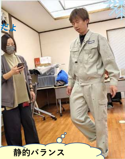
静的バランス (閉眼片足立ち)