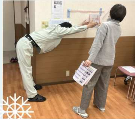
動的バランス (ファンクショナルリーチ)