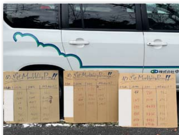
イベント時の歩数の記録