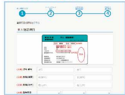
オンラインユーザー登録画面

URL https://pepup.life/users/ekyc/EuSc7ZUV/sign_up