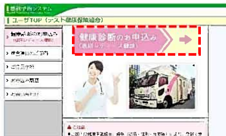
③ 「健康診断のお申込み」をクリック