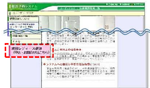
② 「巡回レディース健診」をクリック