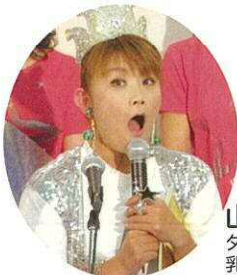
山田邦子さん タレント 乳がん体験者

山田邦子さん率いるスター混声合唱団が厚生中央病院にやってきます!山田さんご自身の乳がん体験の話を交えた、楽しい歌とトークを繰り広げます。どんなメンバーが歌うかは、当日までのお楽しみ!皆さんもご一緒に大きな声で歌って元気をいただきましょう。