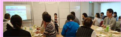
ランチと健脚セミナー