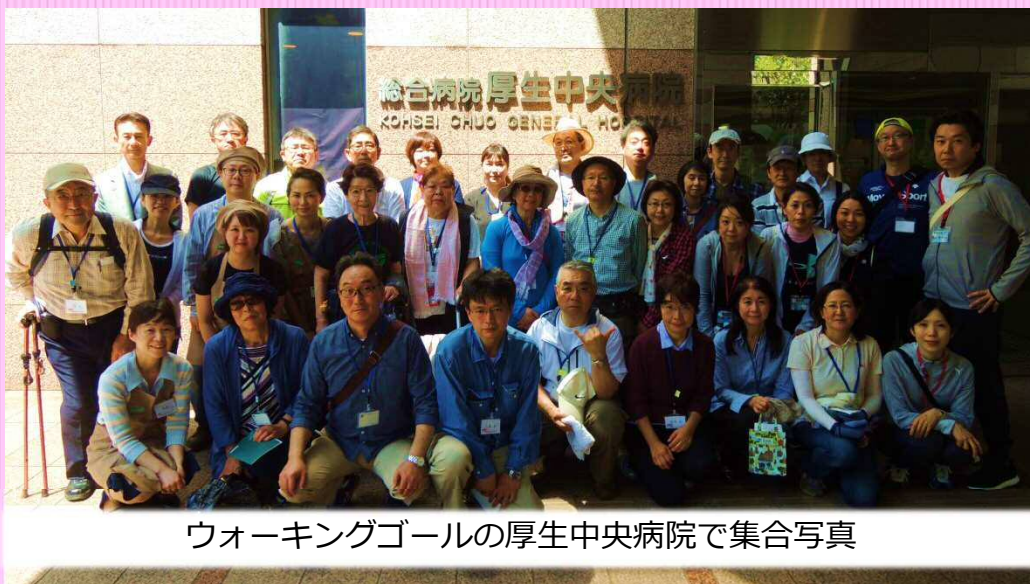
ウォーキングゴールの厚生中央病院で集合写真