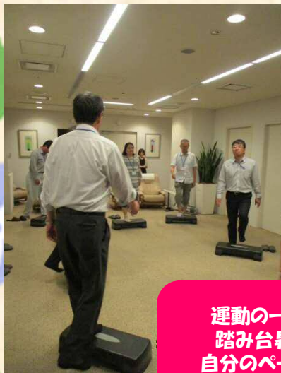
運動の一例: 踏み台昇降 自分のペースで 楽しみながら♪