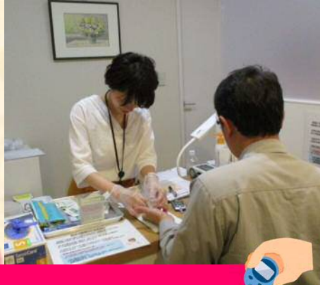
保健師による血糖測定