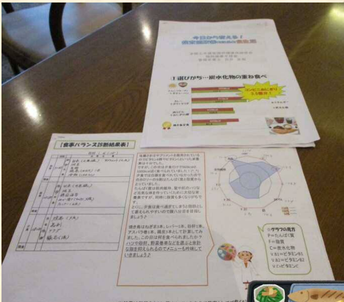
管理栄養士による講話& 栄養バランス診断 普段の食事のバランスを詳しくチェック!