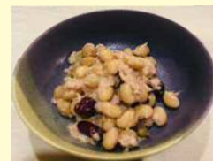
ツナ缶とミックス ビーンズのサラダ