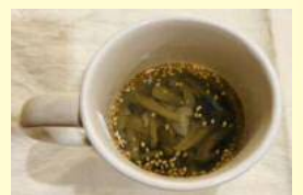
きのこの簡単 鶏ガラスープ

「おいしかった」「楽しかった」 「バランスを考えて食事したいと思った」 「睡眠や食生活に気を配ろうと思った」 などの感想をいただきました！